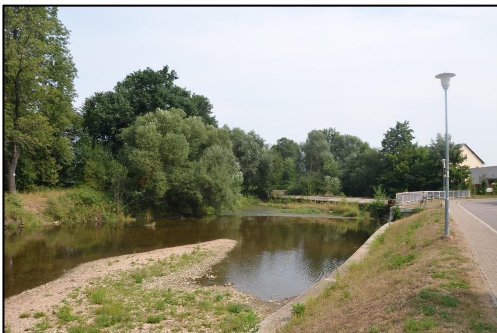
PPO Ústí nad Orlicí